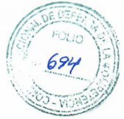
Cuadro N° 1