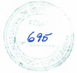
Cuadro N° 2