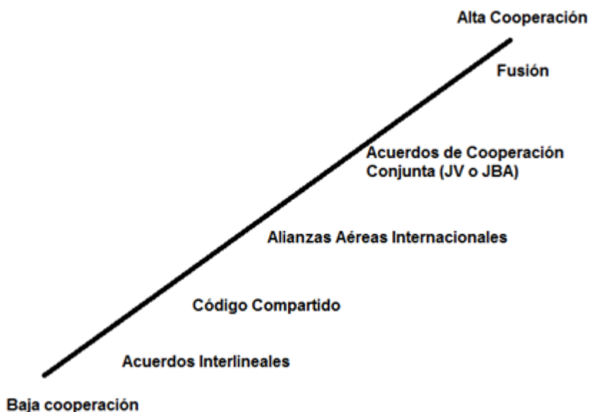
Ilustración N° 2. Modelos de cooperación entre aerolíneas comerciales