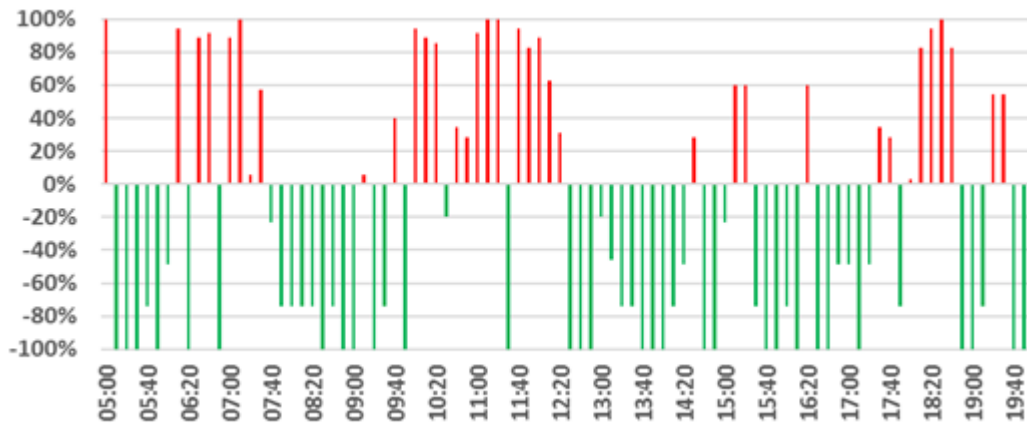
Ilustración N° 3. Nivel de congestión en el Aeropuerto Internacional de Roma