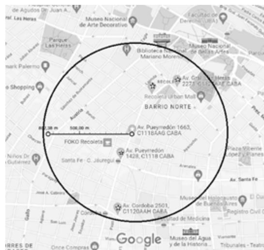
(g) Las Heras 2273. WESSEN S.R.L.